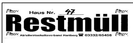
Aufkleber für die Restmülltonne

Für die 6-wöchentliche Abfuhr sind weiße Aufkleber und für die 3-wöchentliche Abfuhr grüne Aufkleber vorgesehen.